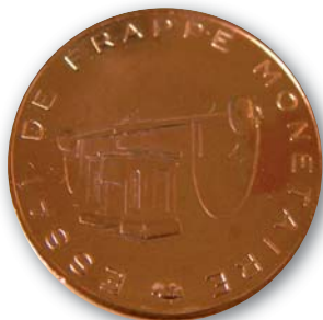
Essai de frappe de l'euro. A l'avant, un balancier.

Comme à leur habitude, les établissements monétaires de Pessac ont procédé à des essais de frappe avant de lancer la production des pièces euro. Il n'est pas rare de voir des essais de frappes de francs dans des ventes ou des revues spécialisées, par contre des essais d'euros sont rarissimes. Il est donc temps de les présenter en détails. Bien qu'il y en ai très peu, nous en avons identifié trois types. Les différences étant dues à l'évolution des caractéristiques techniques des pièces. En effet, les ateliers de frappes n'ont pas attendus le cahier des charges final pour procéder à des essais. Du coup, on se retrouve avec une évolution de trois types de séries d'essais avec des variantes de matériaux, de poids, de diamètres... Mais, comme pour certains essais de frappe de francs, les visuels sont un balancier d'un côté et l'établissement de Pessac de l'autre.