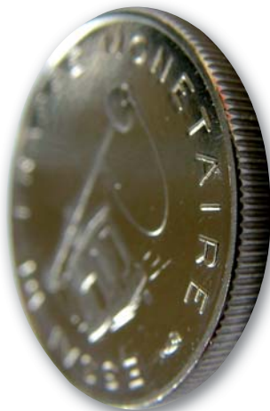
Agrandissement d'un essai de 50 cents d'euro. La tranche est à stries fines.

Ce coffret est composé de neuf pièces. Et oui neuf, car à l'époque certains pays étaient partisans d'utiliser une pièce de 5 euro plutôt qu'un billet, donc le module de 5 euro bimétallique a aussi été prévu dans les essais. L'autre particularité de ce coffret est que les pièces de 10, 20 et 50 cent sont de couleur blanche, probablement en nickel. Mais surtout les tranches de la 10 et 50 cent sont à stries fines, comme notre ancienne demi-franc Semeuse.