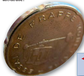
Agrandissement d'un essai de 20 cents d'euro. La tranche a sept cannelures profondes.

Le 3 e type : fabriqué après le 18 novembre 1998, date de la modification des tranches de la 10 cent et 50 cent. Cette série a été reconstituée à partir de pièces trouvées de façon isolées uniquement. Elle n'a sans doute jamais été mise en coffret. Ce qui change par rapport aux deux autres types : les pièces de 10, 20 et 50 cent sont de couleur jaune (or nordique). La 50 cent a été alourdie.