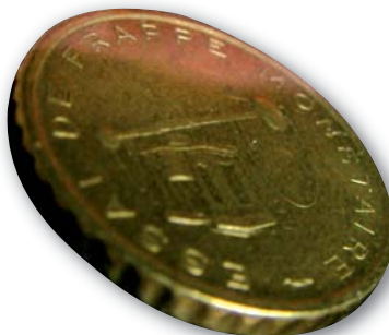
Agrandissement d'un essai de 50 cents d'euro. La tranche est à stries larges.

Ce qui change principalement par rapport à la série précédente : la pièce de 50 cent. Elle est en or nordique jaune et a des cannelures larges cette fois.