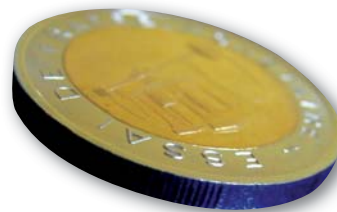
2 euro type 2 avec les alternances de stries fines et son grand insert.

La 2 euro quant à elle, a un insert de diamètre plus grand et a un poids de 8,53 g, ce qui fait que cette série se rapproche un peu plus du type adopté. En effet, nous pouvons voir que l'insert va jusqu'à la limite inférieure de la légende « essai de frappe monétaire », tandis que, pour le 1 er type, l'insert n'englobait même pas le balancier dans son intégralité. Les coins et la virole étaient identiques, par contre le flan utilisé était légèrement différent.