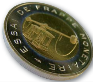
2 euro type 1 avec les alternances de stries fines peu marquées et petit insert.

Une autre particularité, sur la tranche de la 2 euro il y a une alternance de stries fines, (soit