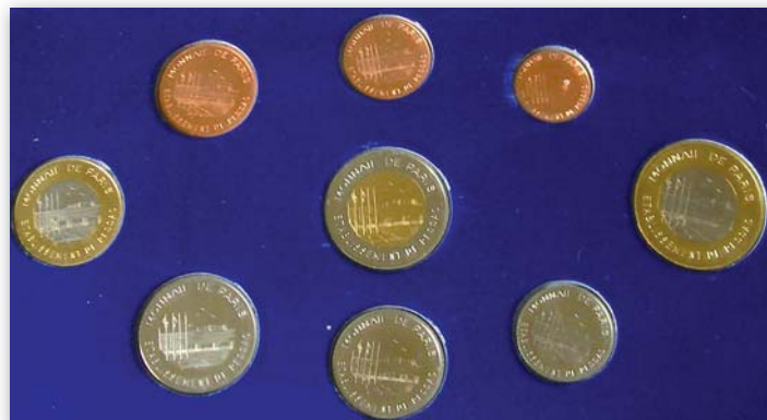
Intérieur d'un coffret d'une série d'essai.

important car cette nouvelle monnaie est faite pour durer, et surtout elle est commune à toute l'Europe, il ne fallait donc pas faire d'erreur du genre « utiliser un matériau allergène ». Afin de faire le meilleur choix, des tests pratiques avaient été effectués avec des machines mais aussi avec des personnes non-voyantes. Après ces tests, il a été décidé de modifier la tranche des 10 cent et 50 cent d'euro ainsi que le poids de la 50 cent d'euro pour faciliter leur distinction. L'information officielle de ce changement est disponible sur le site du parlement européen : http://www.europa.eu/press/sdp/journ/fr/1998/n9811181.htm#7 .